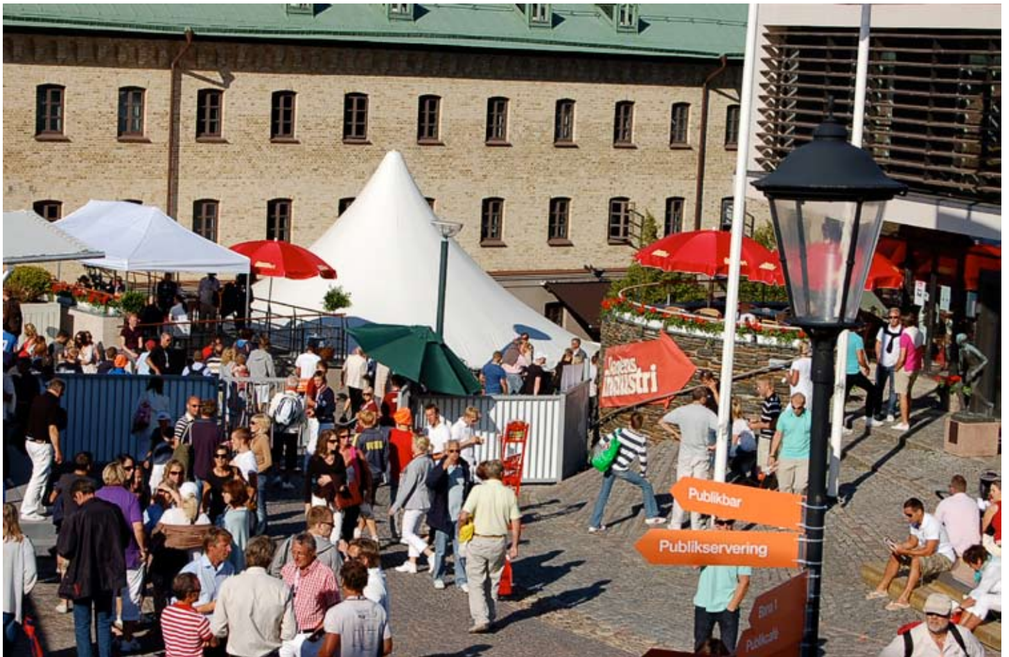
Flera tidningar och tevebolag följde Catella Swedish Open.