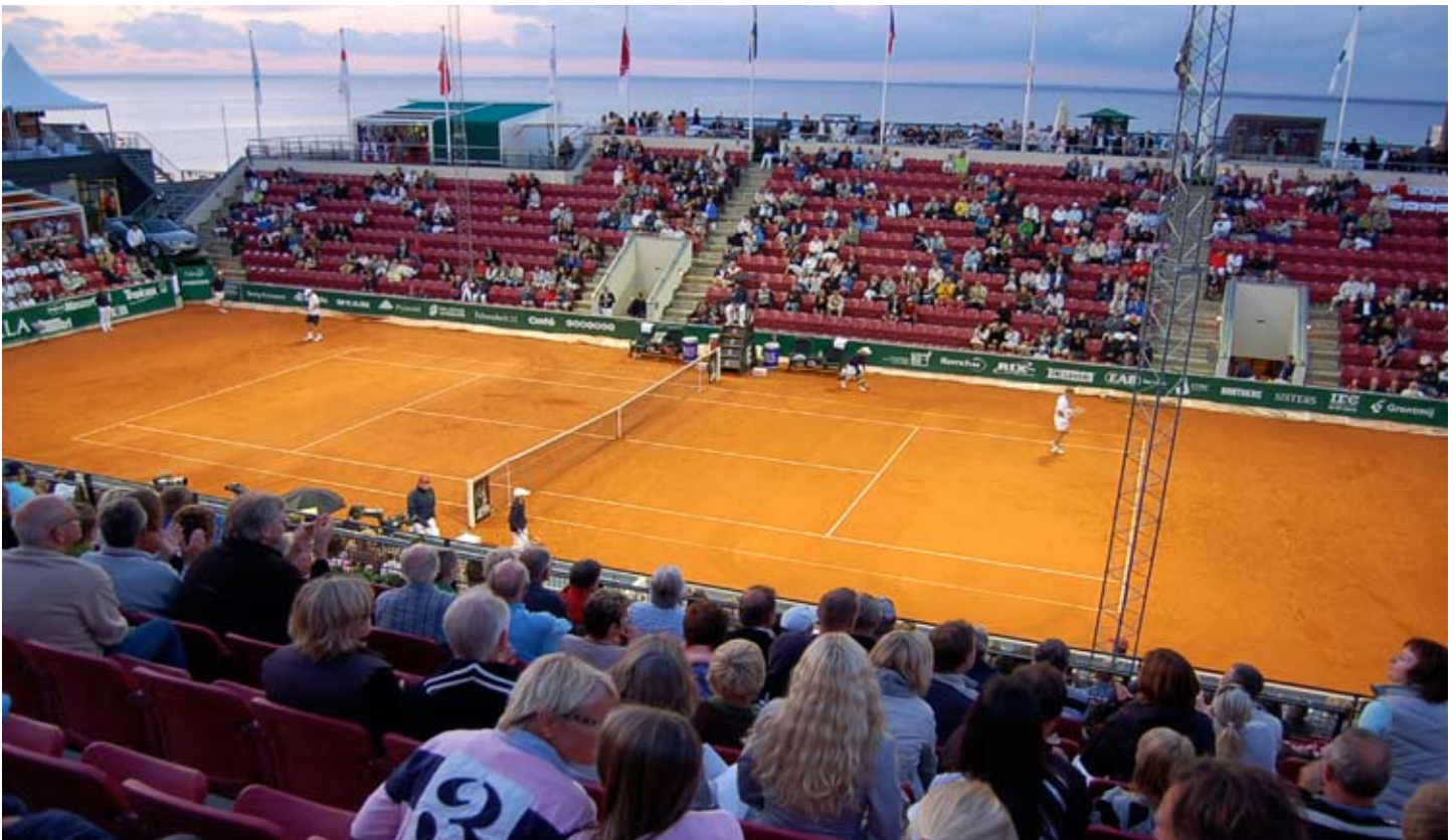
Nya centrecourt i Båstad bjuder på utsikt mot Torekov.